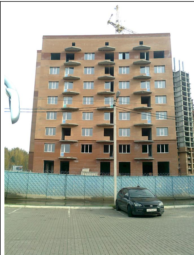
Kuvassa kohta valmistuvaa asuntotuotantoa Hakkapeliitta Village kakkosessa.

Alustusta seurannut tehdaskierros taisi olla monelle ensimmäinen kokemus kuminpaistamisympäristöön.