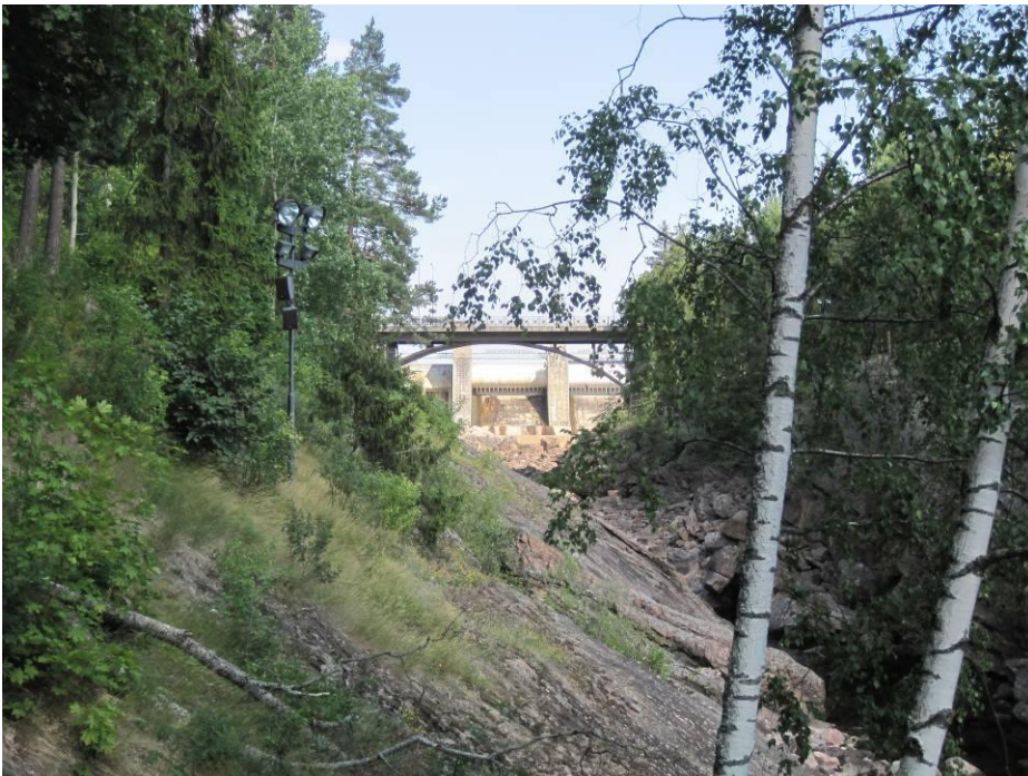
Koski ilman vettä