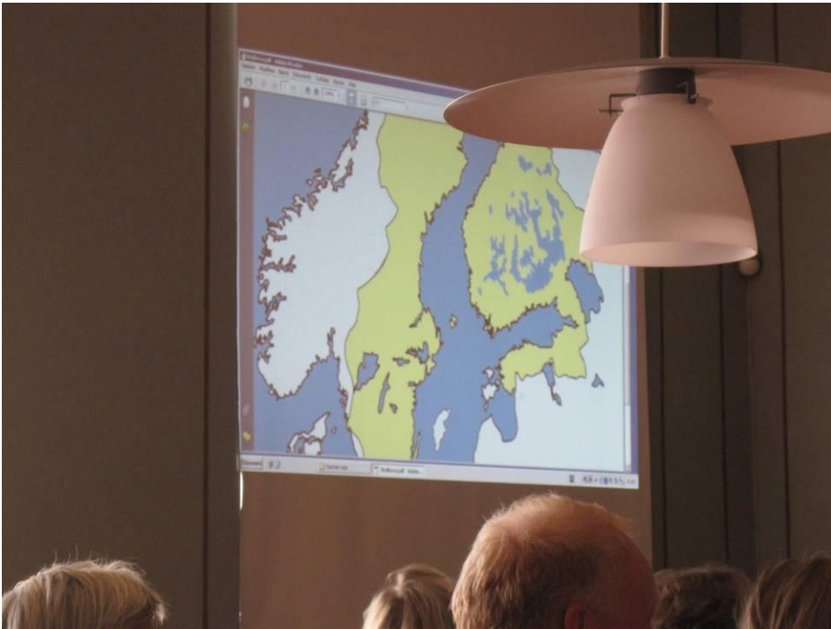
Suomen historiallisia rajoja, esitelmä Lappeenrannassa