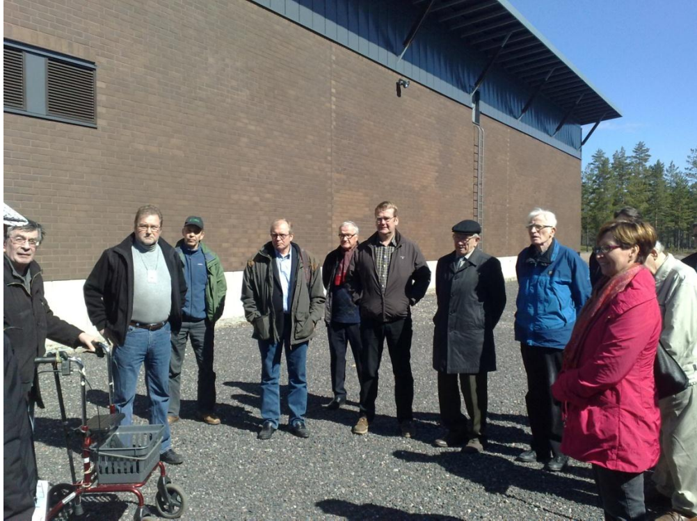
Tutustumiskohteena Turun seudun vedenhankinta

Seniorien toiminnassa ovat myös seniorat olleet mukana silloin, kun on sopivaa ohjelmaa järjestynyt. On käyty joukolla teatterissa ja taidenäyttelyssä. Aivan viimeksi kävimme joukolla katsomassa Reidar Särestöniemen näyttelyn Turun Taidemuseossa. Suunnitteilla on ollut myös yhteisiä matkoja, mutta suunnittelua pitemmälle ei ole päästy.